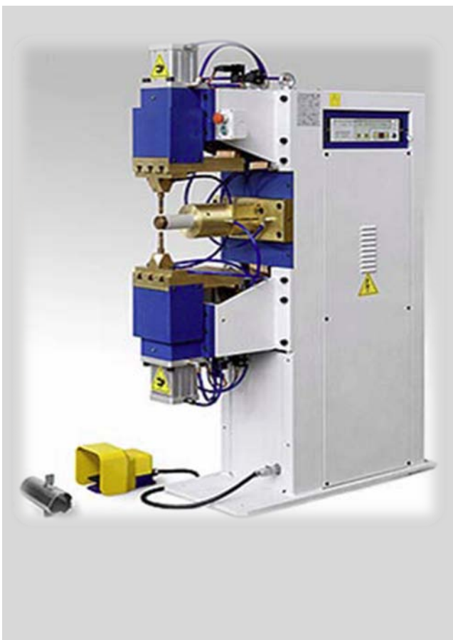
Maschinenbau Serie PPN mit unterem und oberem Schweißhub Mittelaufnahme für Rohr Beidseitiges Aufschweissen von Stutzen