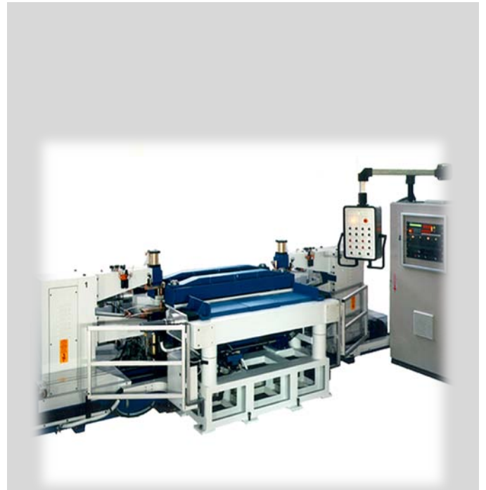
Maschinenbau Serie PPN Breitbandschweißanlage 2 Stück PPN taktweise verfahrbar mit Klemm- und Positioniermaschinentisch