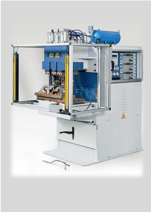
Maschinenbau Serie PPN 3 Kopf - Schweißmaschine Buckelschweissen von Laschen auf Rohr